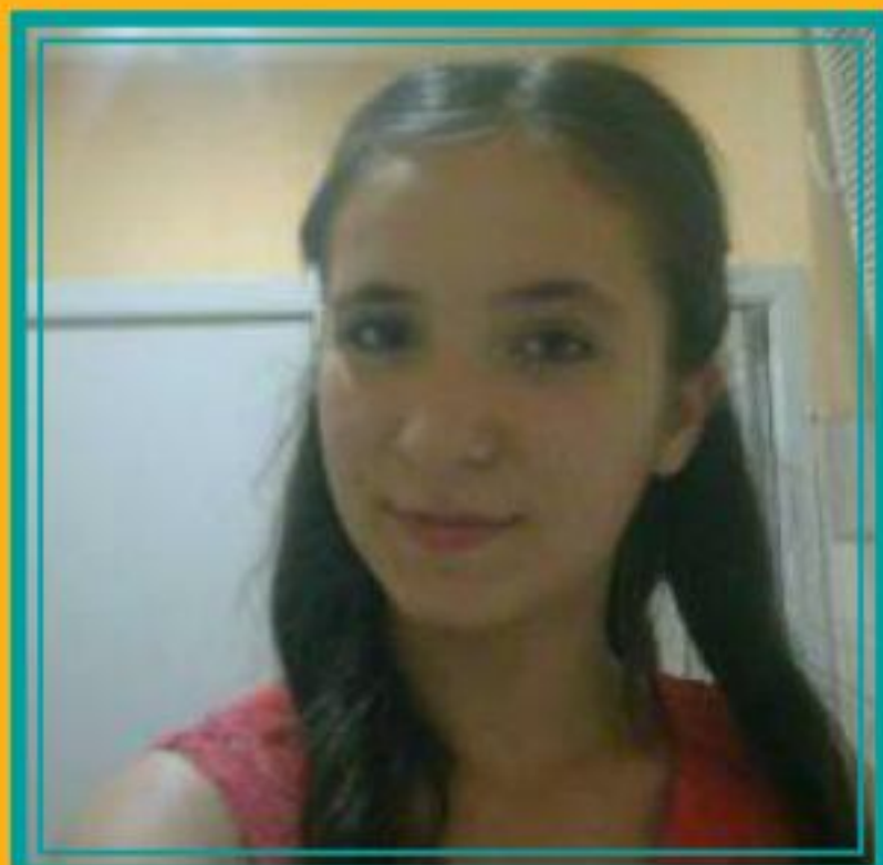
PRIPREMILA: ANISA GICIĆ, 11