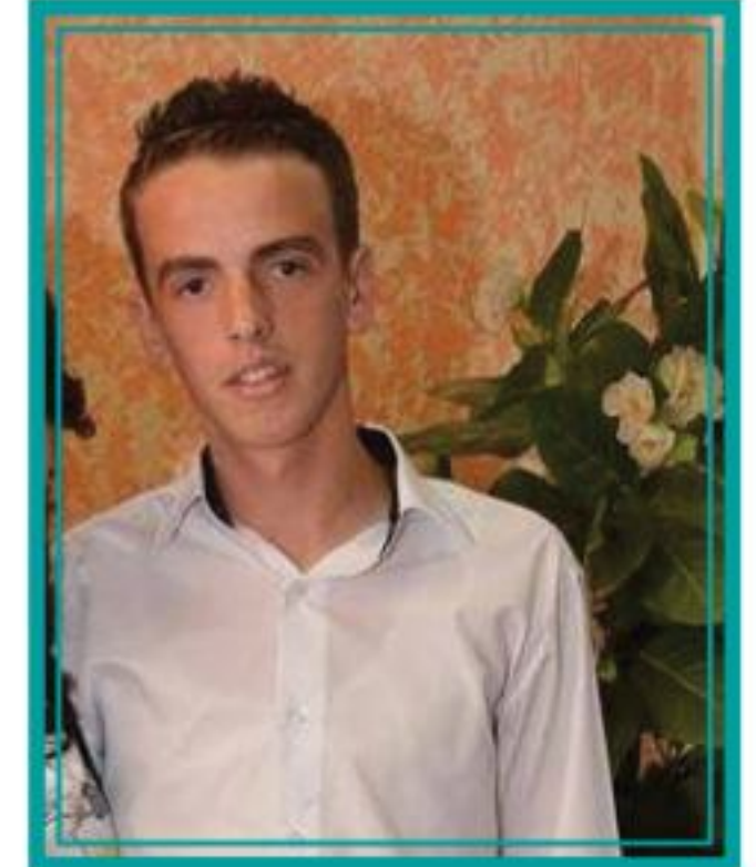
PIŠE: ALMIN KALENDER, IV3

U našem kraju često slušamo priče kako život sve teži je, kako borbe za opstanak sve više je, kako vremena koja dolaze biće sve bezizlaznija, pa većina mladih traži spas i perspektivu „preko granice“, u inostranstvu. Traži svoj put ka boljoj, lepšoj budućnosti.